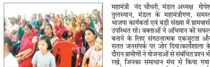
जनभागीदारी को सबसे महत्वपूर्ण बताते हुए उन्होंने कहा कि जागरूक नागरिक ही विकसित भारत की नींव रख सकते हैं। कार्यक्रम में जिला