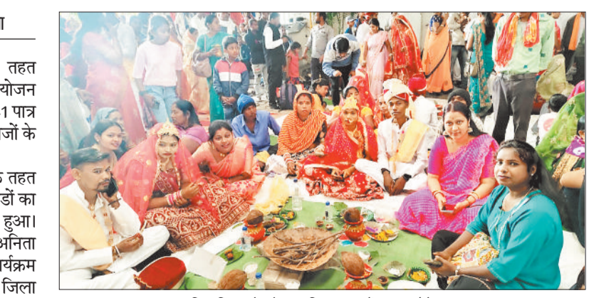
सामूहिक विवाह के दौरान परिणय सूत्र में आबद्ध होते वर वधु